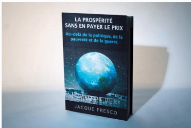
La prospérité sans en payer le prix (e-Book, French)